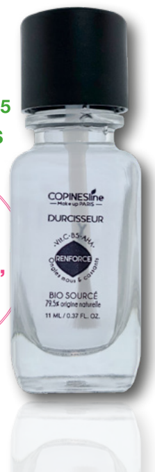
VAOCO3222 11 ML