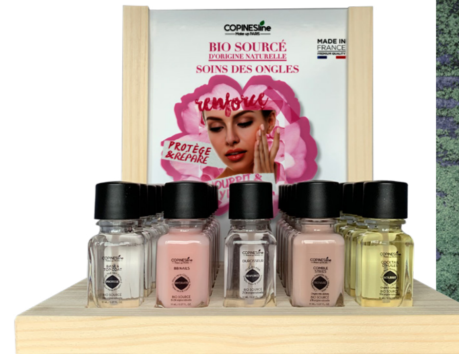
PRECO1572 H 21 cm x L 20 cm x P 22 cm