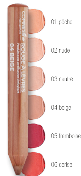
RALCO3214B 1,7 GR

Des teintes lumineuses, intenses et irresistibles.