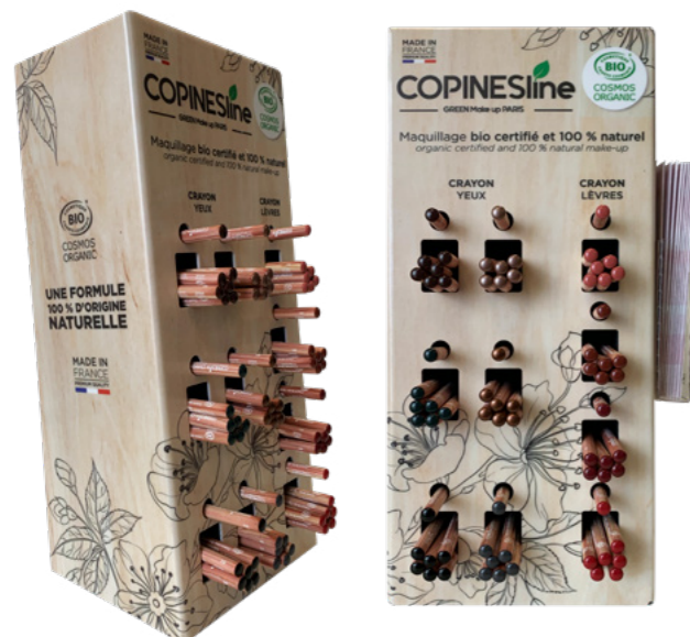
PRECO1570 H 35,5 cm x L 16 cm x P 10 cm