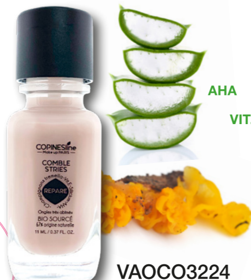
VAOCO3224 11 ML