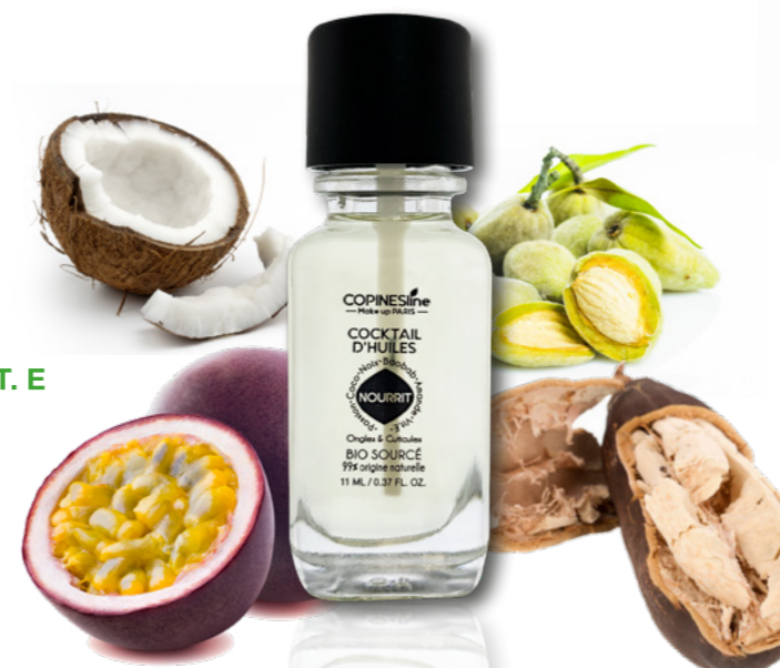
VAOCO3225 11 ML