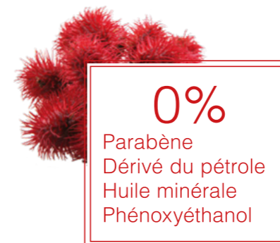
CRLCO3213B 1,04 GR

Un CRAYON ROUGE À LÈVRES spécialement conçu pour colorer et sublimer les lèvres. Grâce à sa texture douce et onctueuse ( Esters de Jojoba & Esthers d'Huile d'Olive ), l'application est facile et agréable, les lèvres sont souples & douces.