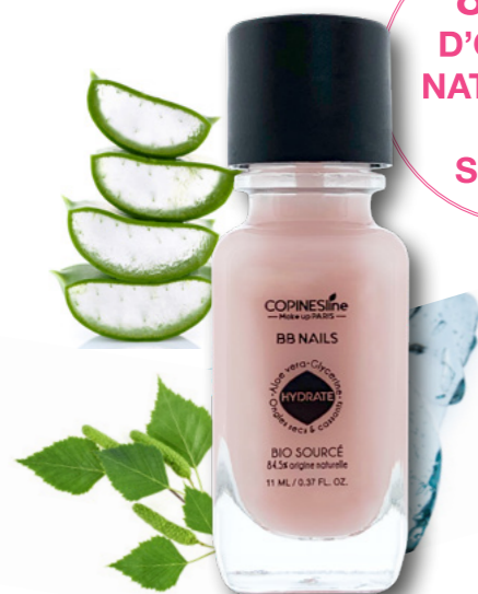
VAOCO3223 11 ML