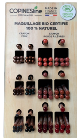
PRECO1571 H35,5 cm x L 20 cm x P 10 cm