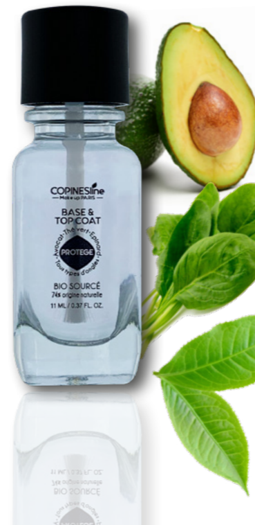
VAOCO3221 11 ML